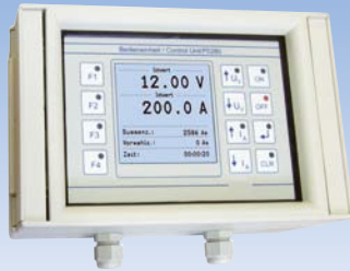
Option EA-PS 280