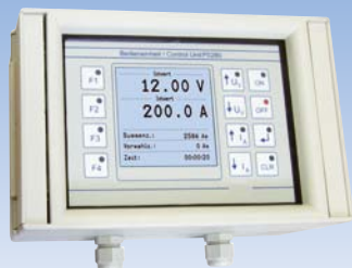
Option EA-PS 280