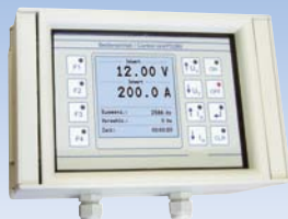
Option EA-PS 280