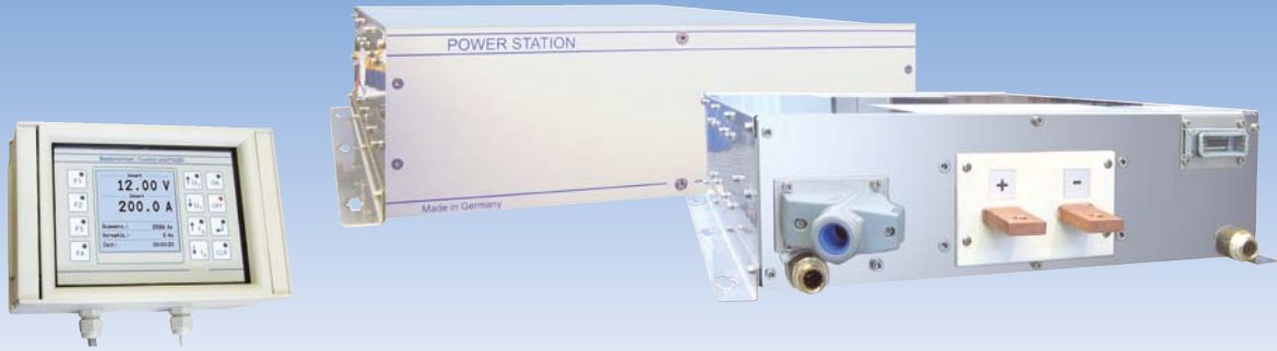
Option EA-PS 280